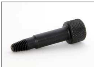
AZ0044-01 ИЗВЛЕКАТЕЛЬ ОПОРНОГО КОЛЬЦА