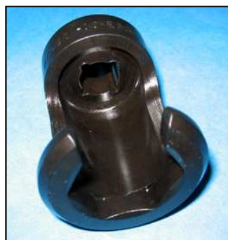
AC0501-00 КЛЮЧ ДЛЯ СНЯТИЯ СОЛЕНОИДА