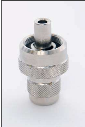
AAZ034-619 ИЗВЛЕКАТЕЛЬ И УСТАНОВЛИВАТЕЛЬ SEEGER СОЛЕНОИДА