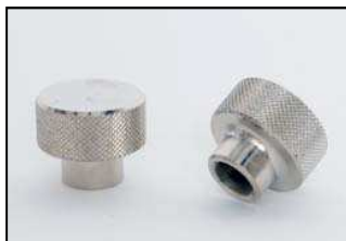
AAZ034-667 ЗАЩИТА ДЛЯ РЕЗЬБЫ