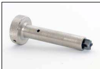
AAZ034-682 ИНСТРУМЕНТ ДЛЯ ЧИСТКИ РЕЗЬБЫ ВХОДА ВЫСОКОГО ДАВЛЕНИЯ ФОРСУНКИ