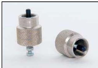
AAZ034-623 ИЗВЛЕКАТЕЛЬ КЛАПАНА