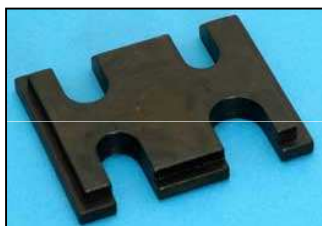
AV0122-03 УНИВЕРСАЛЬНЫЙ БЛОК ДЛЯ ФОРСУНОК