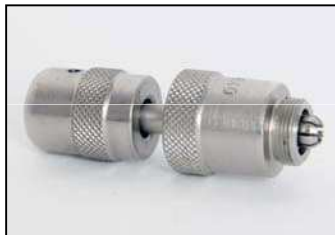
AAZ034-640 УСТАНОВЛИВАТЕЛЬ ОПОРНОГО КОЛЬЦА